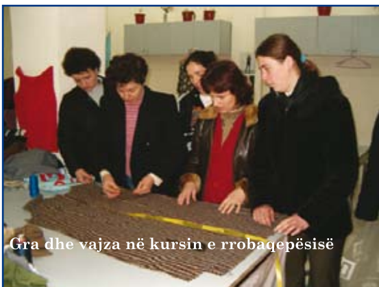
Gra dhe vajza në kursin e rrobaqepësisë